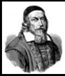
Jan Amos Komenský (1592-1678)